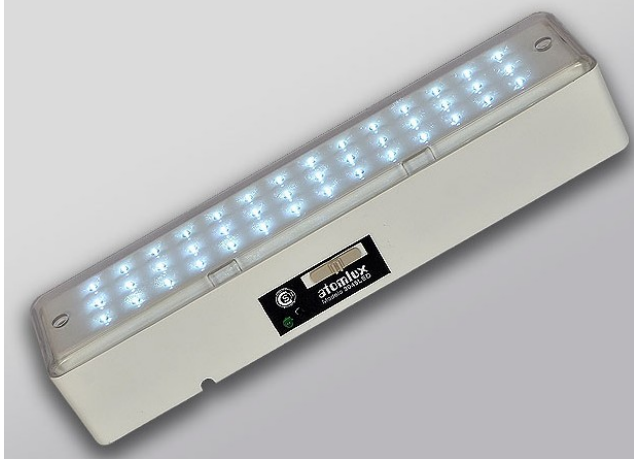
11 LUMINARIA TIPO SE MOD. "EM.35" LUCCIOLA